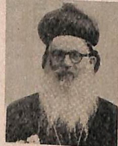
തോമ്മാ മാർ ദിവനാസ്യാസ് മെത്രാപ്പോലീത്താ (പത്തനംപുരം താബോർ ദേവാ)